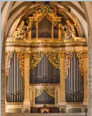
DOM ZU FREIBERG Gottfried Silbermann 1714

Das Jugendorgelcamp bietet Dir die perfekte Gelegenheit, einmal die großartigen und weltberühmten Silbermann-Orgeln zu spielen!