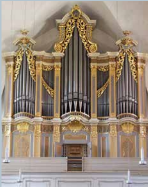
PETRIKIRCHE FREIBERG Gottfried Silbermann 1735